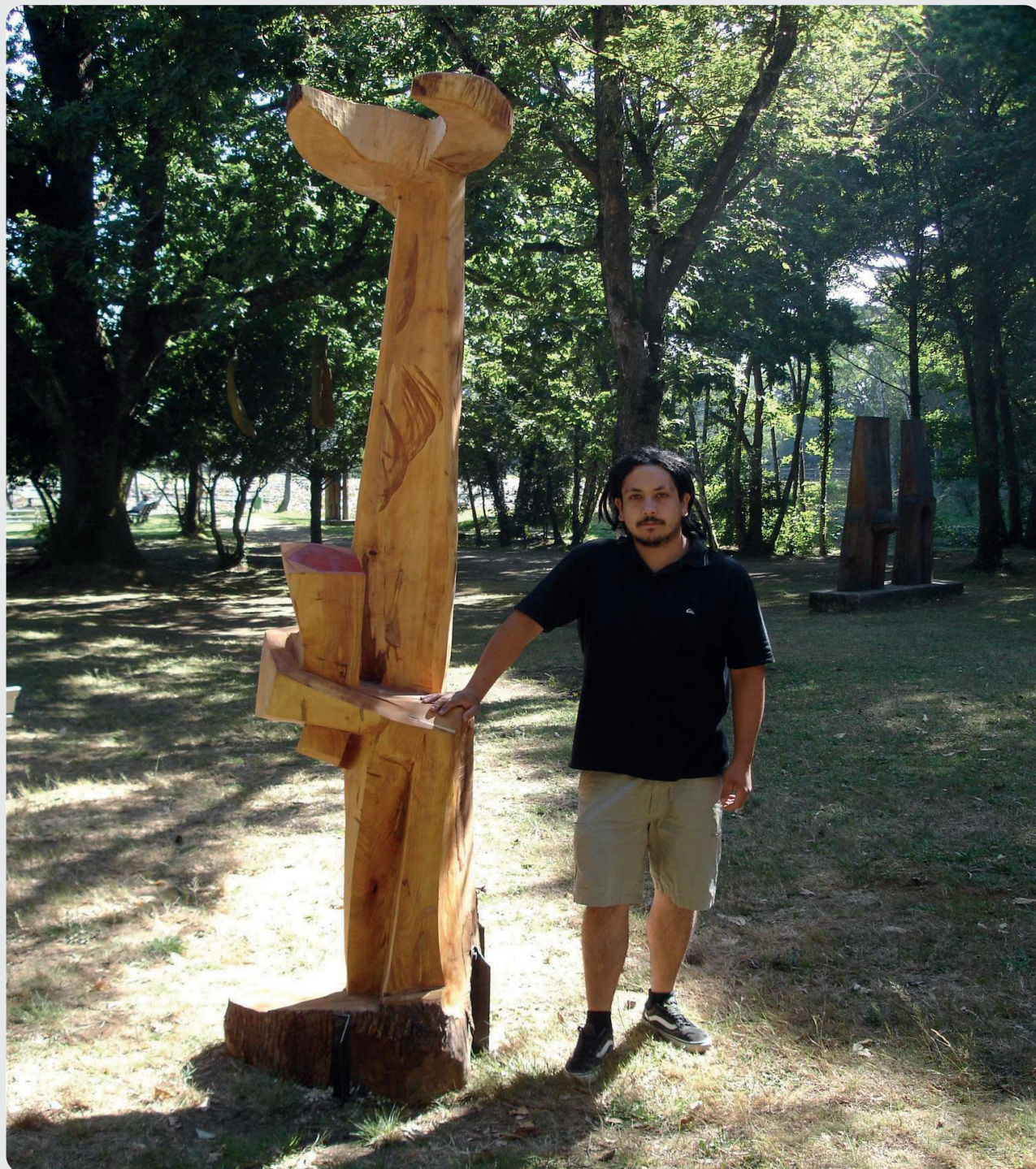
“Abrazando el universo” Madera y metal